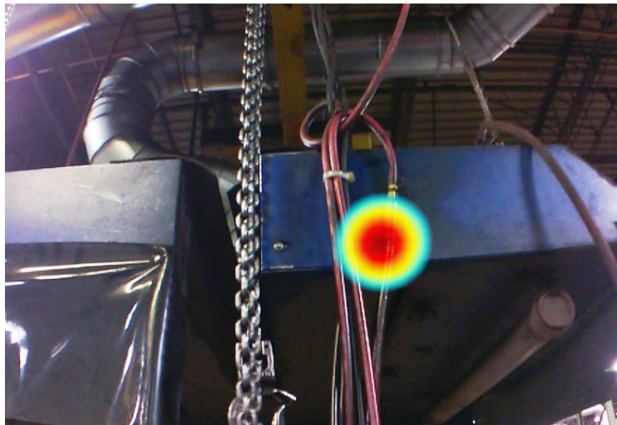
Imágenes tomadas con la cámara acústica industrial ii900 en un entorno industrial.

Fluke. Keeping your world up and running.®